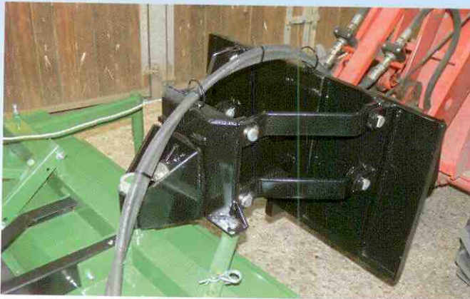
Pendel- und Höhenausgleich Hoftrac und Frontlader