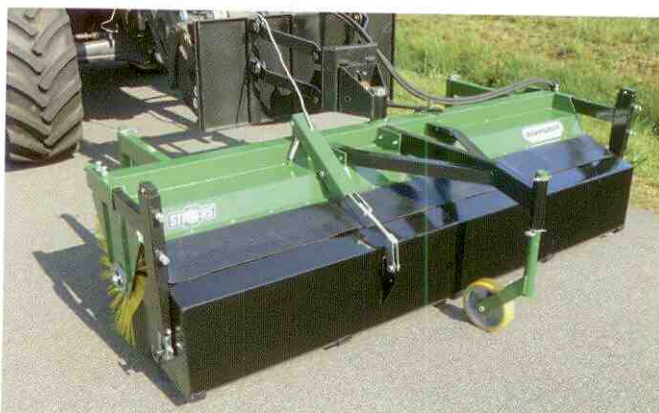
Kehrmaschine mit Pendel-/Höhenausgleich und 3. Stützrad am Frontlader